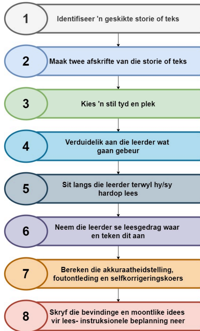
Figuur 1. Proses om RR-aantekeninge uit te voer (aangepas vanuit Burdujan 2020)

Eerstens identifiseer die onderwyser 'n gepaste teks vir die leerder (Burdujan 2020). 'n Teks uit die departementele werkboeke kan gebruik word, aangesien dié werkboeke vrylik beskikbaar is. Tweedens maak die onderwyser twee afskrifte van die teks – een vir die leerder en een vir die onderwyser waarop aantekeninge gemaak word. Dan kies die onderwyser 'n stil plek en tyd en verduidelik eers aan die leerder hoe die proses werk. Die leerder sit dan langs die onderwyser en lees die teks hardop. Terwyl die leerder lees, teken die onderwyser die leerder se leesgedrag (bv. leesfoute) aan (Sudirman 2016). Elke woord wat die leerder korrek lees, word met 'n regmerkje gemerk. Wanneer die leerder verkeerd lees, dui die onderwyser die fout aan, asook die tipe fout deur die toepaslike kode te gebruik (sien Bylaag B vir die tabel met kodes). Die kodetabel dui die tipes foute aan en gee voorstelle oor hoe die foute reggestel kan word. Wanneer die leerder klaar gelees het, ontleed die onderwyser die leerder se gebruik van betekenis-, strukturele, visuele en selfregstellingsleidrade. Die onderwyser bereken ook die leerder se akkuraatheidstelling, fouttelling met leidraadontleding en selfregstellingskoers deur die formules in Bylaag C te gebruik.