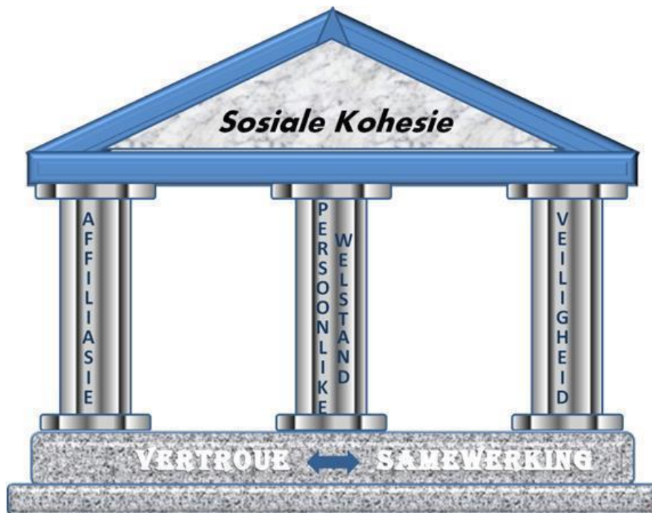
Figuur 2: Model vir sosiale kohesie

Daar is reeds in hoofstuk sewe erkenning gegee aan die feit dat algehele sosiale kohesie in Suid-Afrika bemoeilik word deur die feit dat daar binne baie gemeenskappe steeds onvoldoende voorsiening gemaak word vir basiese fisiologiese behoeftes. Sonder kos en water vervaag alle ander behoeftes. Sosiale kohesie is van geen belang vir iemand wat dag na dag moet sukkel om skoon water in die hande te kry nie. Dit is ook van geen belang vir iemand wat honger is en nie elke dag kos het om te eet nie. Basiese fisiologiese behoeftes val egter onder die