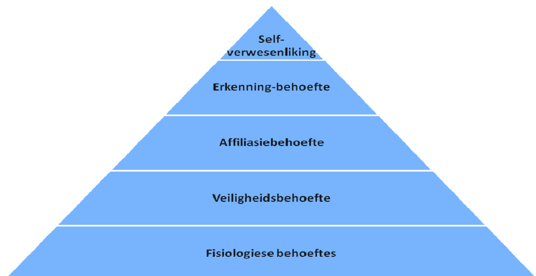
Figuur 1: Maslow se hiërargie van menslike behoeftes

Hierdie barometer sluit in baie opsigte aan by die bekende hiërargie van menslike behoeftes van Maslow (1943:location 54-88). Dit lyk soos volg: